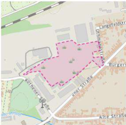
Karte: onmaps ©GeoBasis-DE/BKG/ZSHH

Bitte prüfen Sie ob der angefragte Bereich korrekt dargestellt ist.