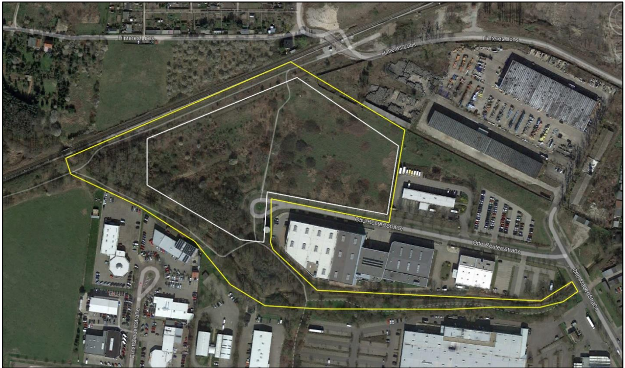
Abbildung 5-2 Abgrenzung des ungefähren Vorhabengebietes (weiß) und des Untersuchungsgebietes (gelb) in Google-Earth (Luftbild 03/2020)