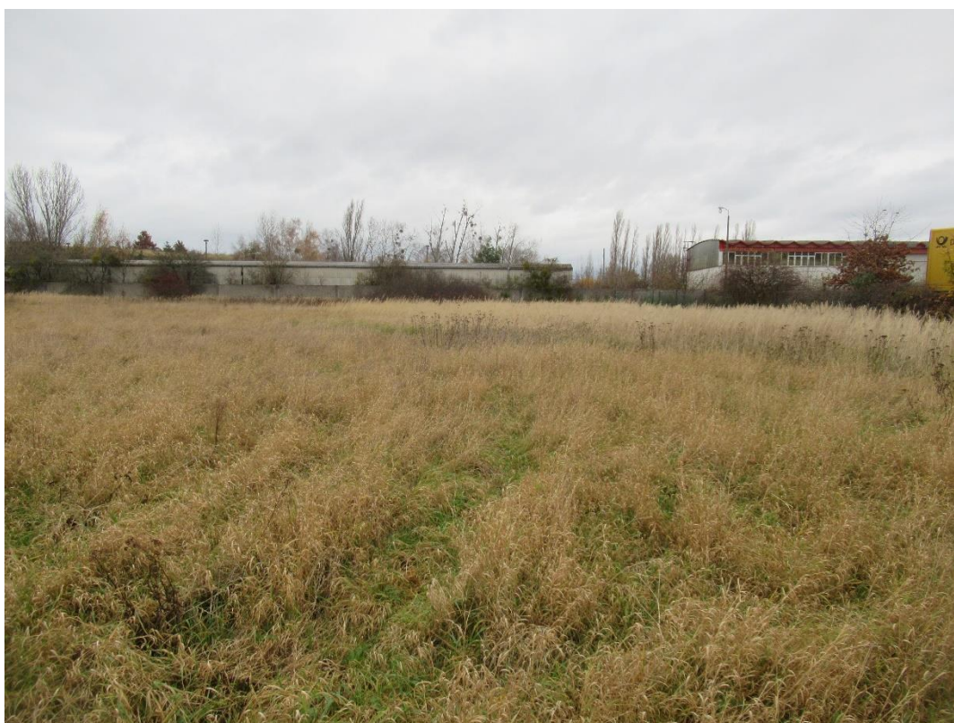
Abbildung 6-4 Brache – geplante Bauflächen