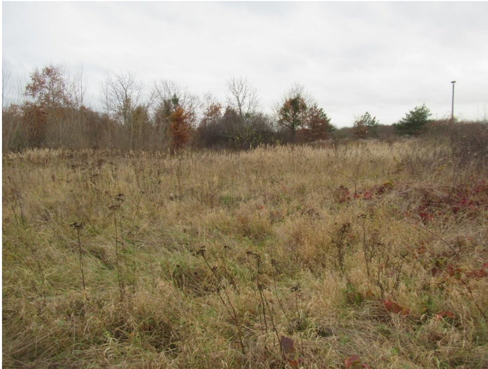
Abbildung 8-3 Dicht bewachsene Flächen des Plangebietes – ungünstige Zauneidechsenhabitate