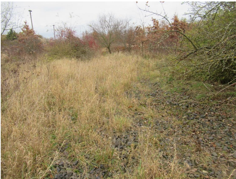
Abbildung 8-2 Strukturreiche Flächen in Bahndammnähe – geeignete Zauneidechsenhabitate

Ein Vorkommen der Schlingnatter wird hingegen aufgrund des erwähnten Mangels an kleinstrukturiertem Wechsel zwischen lückiger und geschlossener Vegetation nicht erwartet. Dieser ist für die Art erheblich relevanter als für die Zauneidechse (GÜNTHER et al. 2009, GROSSE & SEYRING 2015). Da sie im Raum Dessau-Roßlau (Hohe Straße) entlang von Bahnschienen bereits nachgewiesen wurde, ist auch hier eine Ansiedlung in räumlicher Nähe nicht ausgeschlossen. Im Bereich des Bahndammes finden sich ausreichend Strukturen für die Schlingnatter, die Vorhabenfläche selbst ist hingegen ungenügend zum Nahrungserwerb geeignet. Verbotstatbestände können daher ausgeschlossen werden.