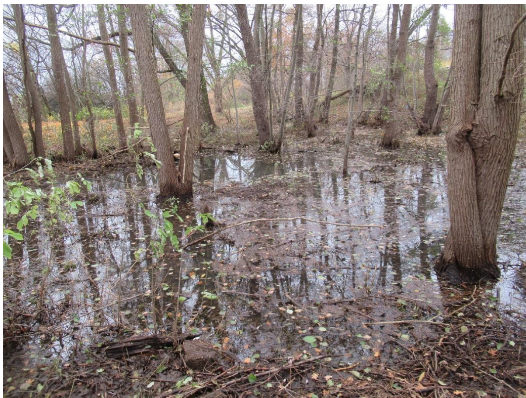
Abbildung 8-1 Überstauungsbereich – potenzieller Lebensraum Amphibien

Ein außerhalb des Geltungsbereiches befindliches Gewässer (Süden) ist stark beschattet und durch die direkte Anbindung an das Fließgewässernetz ist ein Vorkommen von Fischen zu erwarten. Dies sind für Amphibienarten suboptimale Bedingungen, daher ist nicht von einem Laichhabitat auszugehen.