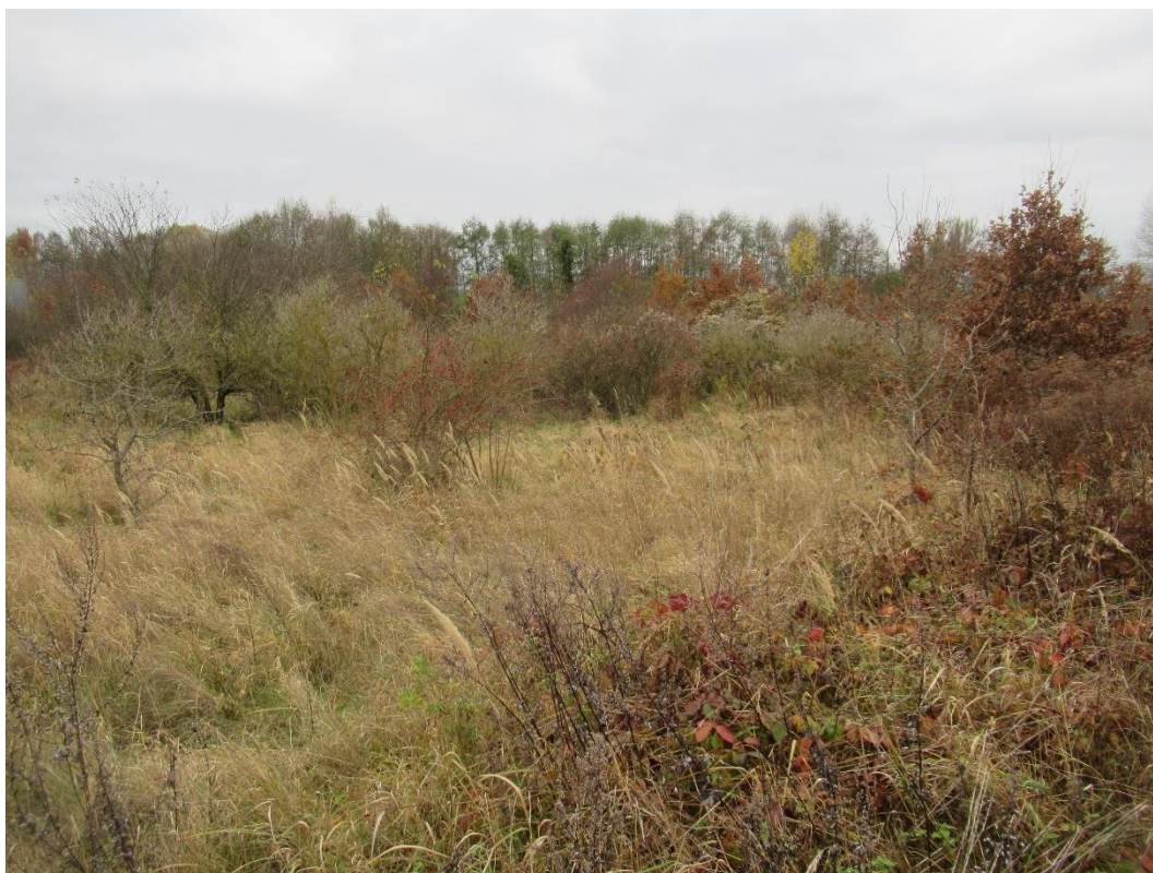
Abbildung 6-3 Brache mit Verbuschung – geplante Bauflächen