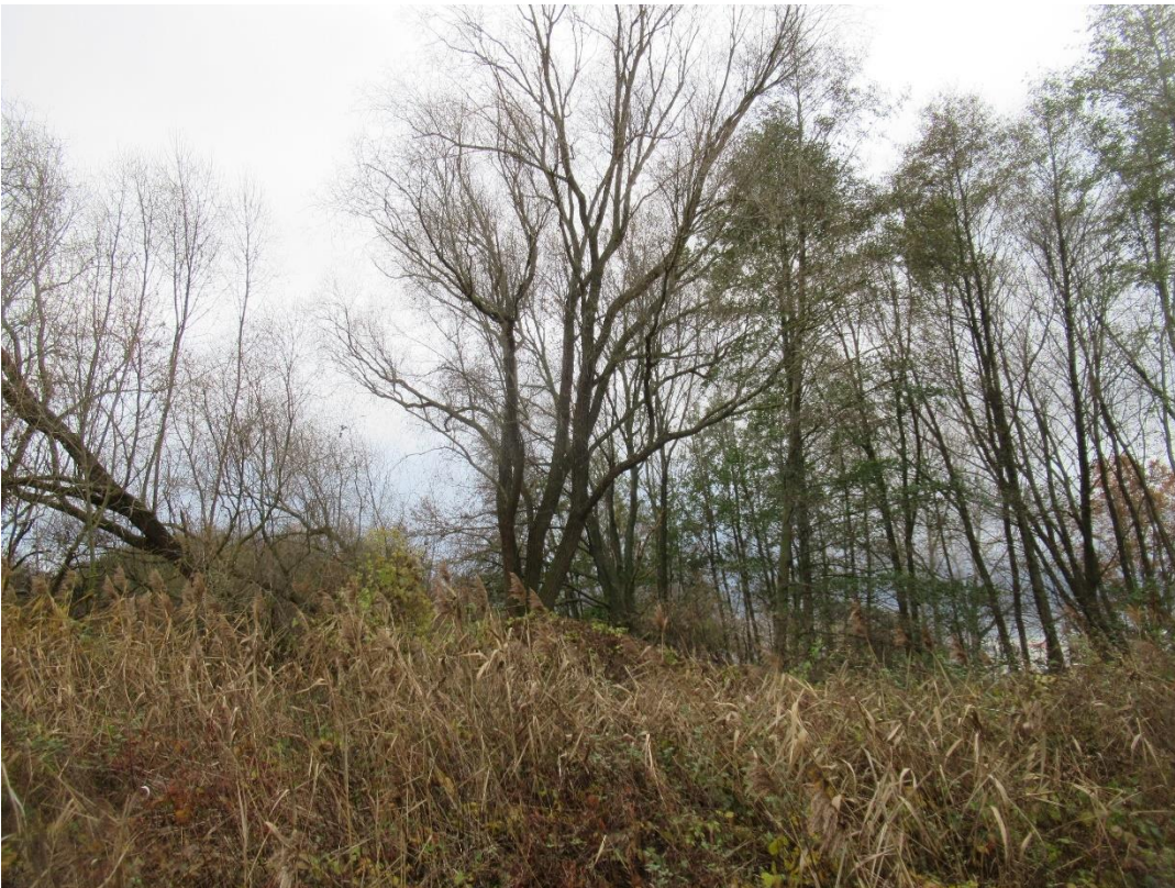
Abbildung 6-2 Flächiges Gehölz im Westen des Plangebietes

Dieser Bereich wird von der Planung nicht beansprucht. Der Zustand bleibt erhalten.