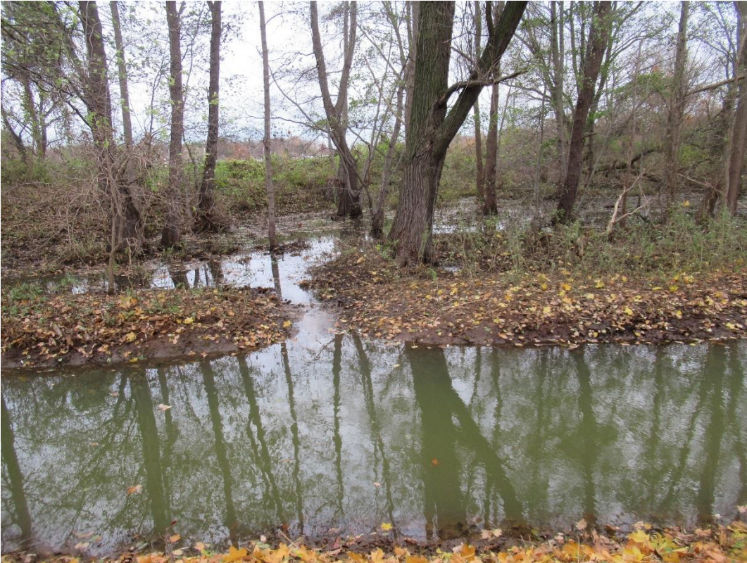
Abbildung 6-1 Taube Landgraben mit Überstauungsbereich

Dieser Bereich wird von der Planung nicht beansprucht. Der Zustand bleibt erhalten.