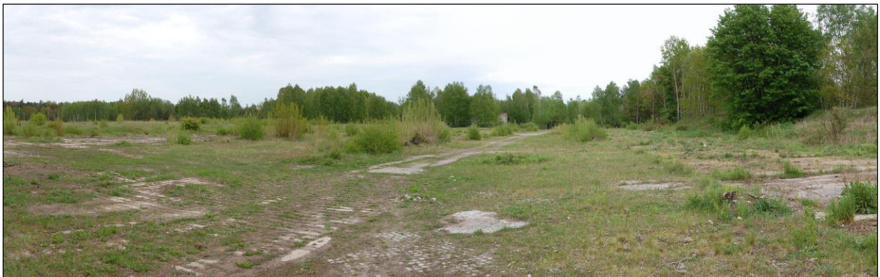
Abbildung 8: Befestigter Platz innerhalb der Vorhabenfläche

Innerhalb der Vorhabenfläche befindet sich ein mit Betonplatten und Plastersteinen befestigter Platz mit mehr als 0,5 ha Flächengröße. Der Bewuchs ist eher spärlich und vorwiegend auf die Fugen der Platten beschränkt. Vom Artenspektrum sind vorwiegend trockenresistente Arten aus der umgebenden Ruderalflur (siehe URA) anzutreffen.