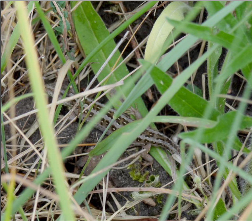
Abbildung 2: am 01.06.2018 fotografierte Zauneidechse inmitten der Vorhabenfläche

Im August konnten dann auch juvenile Individuen auf der Fläche aufgefunden werden, was einen eindeutigen Hinweis auf die Reproduktion der Zauneidechsen auf dieser Fläche darstellt.