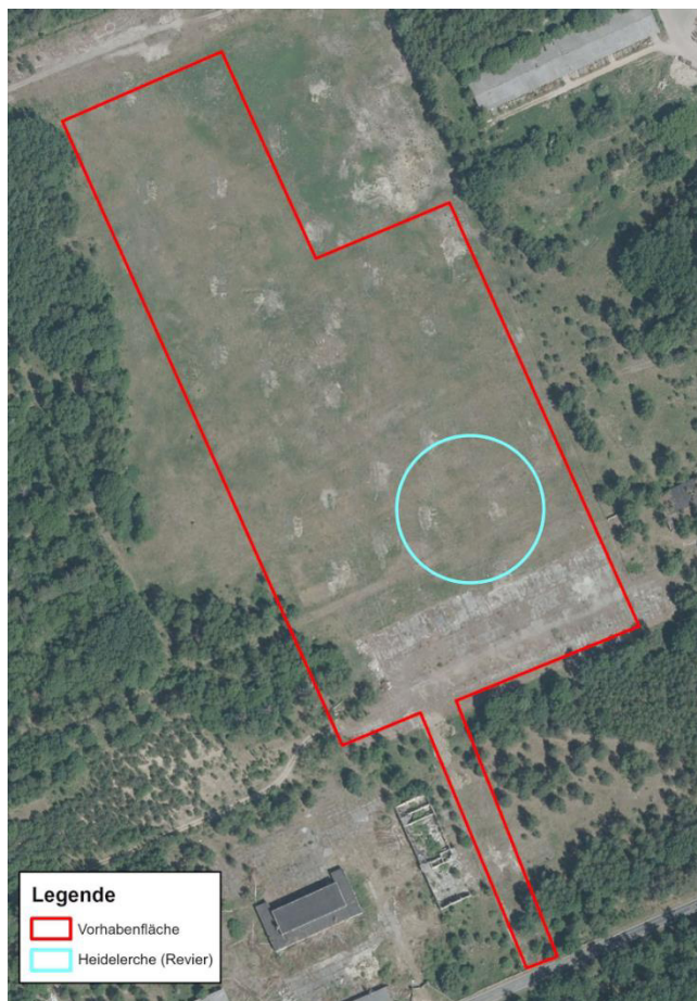
Abbildung 4: Revier der Heidelerche

Für das Vorhaben wurde an allen 5 Kartierterminen (vgl. Tabelle 1) das Vorkommen von Brutvögeln auf der Vorhabenfläche untersucht. Bis auf ein Revier der Heidelerche (vgl. Abbildung 4) inmitten der Vorhabenfläche konnten keine weiteren Brutvögel festgestellt werden. Anhand der Biotopausstattung und -ausprägung werden daher potenziell vorkommende Arten aufgezählt und deren Gebietsbedeutung analysiert.