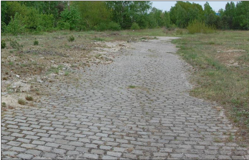
Abbildung 7: Reste eines befestigten Pflasterweges im Norden der VHF