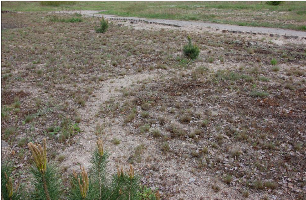
Abbildung 6: Silbergrasflur außerhalb von Dünen nördlich der Vorhabenfläche

Zwischen Vorhabenfläche und Bahntrasse ist auf einem linienhaften Bereich eine Silbergrasflur aufgewachsen. Die Flächen waren gepflastert. Das Pflaster wurde abgetragen, sodass der magerere Sand des Pflasterbettes übrig blieb. Darauf hat sich eine Silbergrasflur mit Silbergras ( Corynephorus canescens ), Kleinem Habichtskraut ( Hieracium pilosella ), Kleinem Sauerampfer ( Rumex acetosella ), Flechten ( Cladonia spec. ), und einzelnen jungen Waldkiefern ( Pinus sylvestris ) entwickelt.