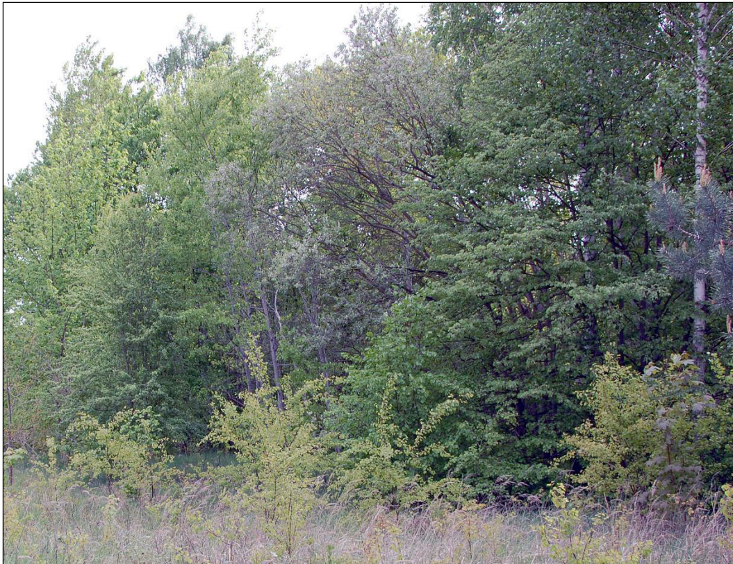
Abbildung 5: Laubholz- Nadelholz Mischbestand im Südwesten der VHF

Land-Reitgras vor allem Taube Trespe ( Bromus sterilis ) und Draht-Schmiele ( Deschampsia flexuosa ) bestandsbildend.