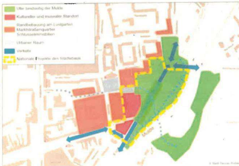
Abbildung: Übersicht „Stadteingang Ost“